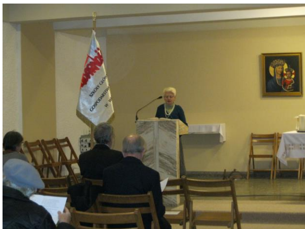
Po mszy spotkałiśmy się pod tablicą rocznicową „Solidarności” SGGW w Pawilonie I przy ul. Rakowieckiej 26/30.