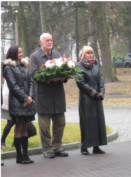
Nasi przedstawiciele składający kwiaty pod tablicą w centralnej części kampusu SGGW

Po Apelu Poległych uczestnicy uroczystości złożyli także kwiaty przed tablicą w centralnej części kampusu uczelni, upamiętniającą wszystkich poległych w wojnach w latach 1918-1945. Społeczność akademicka SGGW dba w ten sposób o zachowanie w pamięci wszystkich studentów i pracowników uczelni, którzy oddali życie za wolność przyszłych pokoleń.